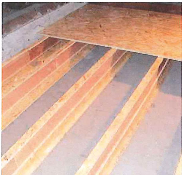
Rošt ze systému EXPANDERŮ CIUR. Při dodatečném zateplení stropů ze železobetonu nelze využít žádnou dutinu. Ta se vytvoří pomocí Expanderů, které je možné následně zaklopit deskami OSB.