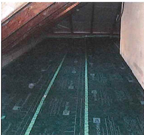
Membrána systému PROCLIMA DA poskytne velmi dobrou sanační funkci v případě, že je třeba zabezpečit vyšší odpor proti průchodu vodních par budoucí vrstvou foukané tepelné izolace. Na tuto vrstvu již lze bezpečně uložit izolaci, i když pod stropem bude prostředí se zvýšenou vlhkostí.