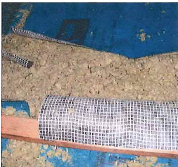
CLIMASTONE – foukaná minerální izolace v okolí staršího komínového tělesa před uzavřením difuzně otevřenou membránou PROCLIMA SOLITEX PLUS