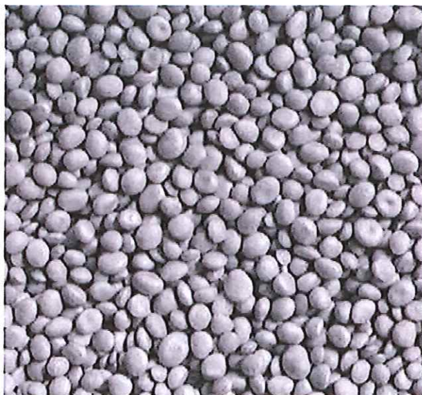
Struktura uzavřených perliček foukaného materiálu CLIMASTYREN EASY FILL. Izolace s vysokou odolností proti vlhkosti.

Climastyren EASY FILL je naopak určen především do prostorů se zvýšeným rizikem vlhkosti. Je vyráběn z prvotřídní suroviny v podobě zcela uzavřených perliček šedivé barvy a hladkého povrchu. Výborně proni-