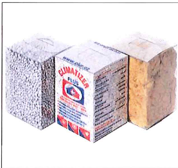
Sortiment foukaných izolací CIUR, a. s., CLIMATIZER PLUS (celulózová izolace); CLIMASTYREN EASY FILL (grafitový polystyren); CLIMASTONE (foukaná izolace z kamenné vlny)